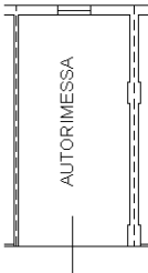
PIANO INTERRATO (H. 2,40)